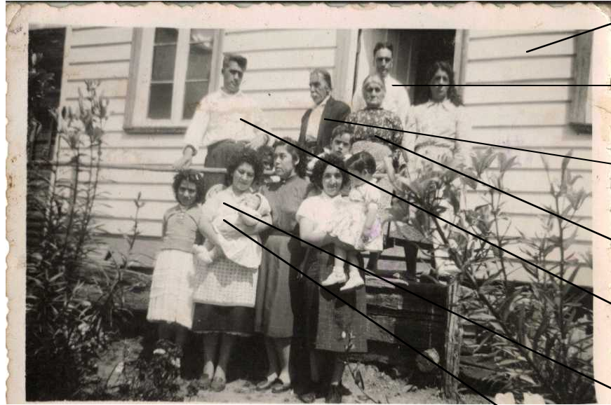
La casa en ribera sur en Aysén que ya no existe